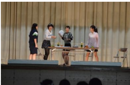
演劇部 発表「四姉妹の不在証明」

自分たちのためではなく、お客様に喜んでもらうために、創意工夫をした発表をすることを、生徒が気づいてくれればと思います。