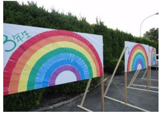
緑総生全員の願いを貼った虹の装飾

文化祭の花形は言うまでもなく文化部です。発表の場が少ないこともありますが、緑総の生徒や他校の友人・家族に日頃の練習の成果を見てもらう絶好の機会です。この日のために、多くの時間を割いて準備をしてきたはず。ほとんどの発表・展示を見させてもらいましたが、気持ちのこもった展示や演奏・演技でした。自分を表現す