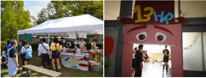
3-5 PIZZA PLANET ピザ販売 1-3 緑総 TOY WORLD

9月12日(金)と13日(土)に本校の文化祭である「緑総祭」が開催されました。前日までの雨が嘘のような好天に恵まれ多くの方にご来場をいただきました。